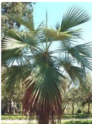
Palma dulce o Palma de sombrero

En San Juan, existe la Palma dulce o Palma de sombrero. La especie Braheadulcis , conocida como Palma dulce o Palma de sombrero, aparece en áreas desérticas y rocosas características propias del territorio sanjuanino.