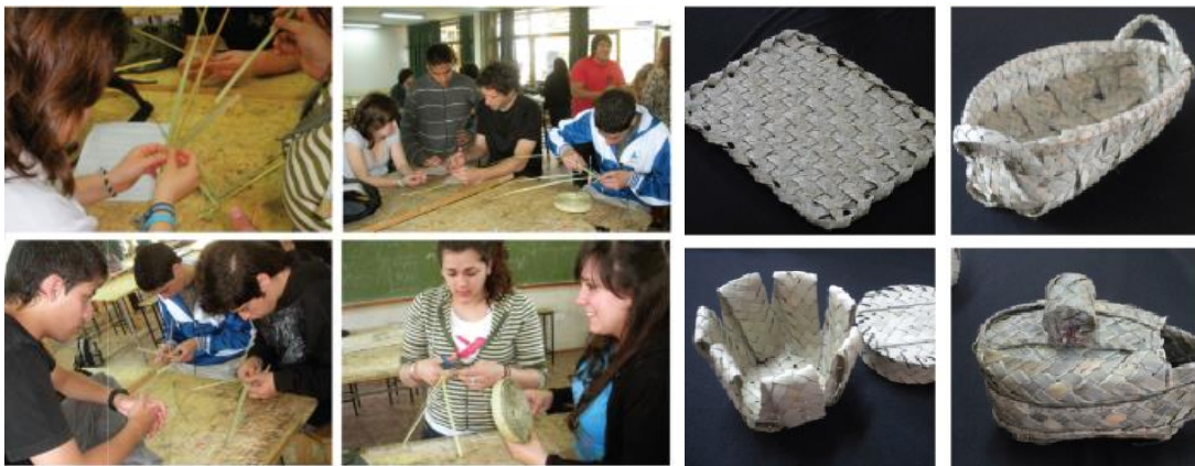
Taller Creativo FUSIÓN ARTESANIA + DISEÑO - Producción de alumnos