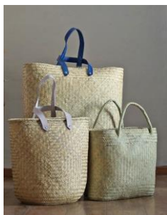
Sombrero de viña y canastos.