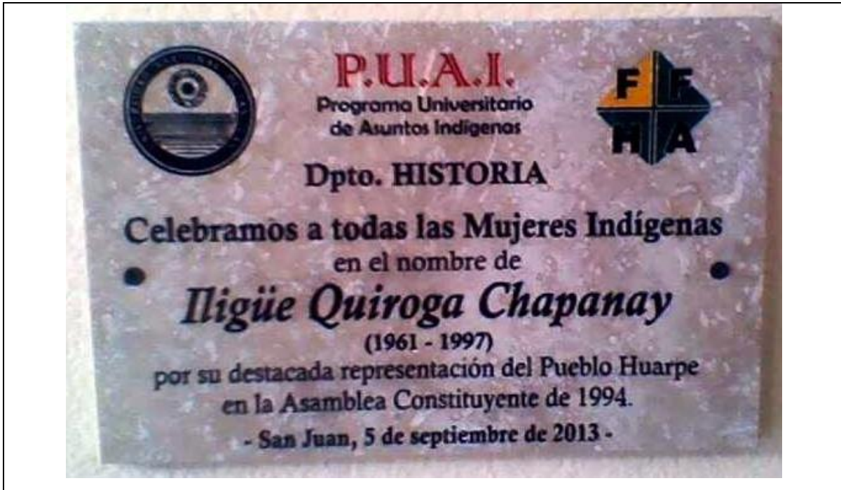
Anexo 3. Acto de la Mujer Indígena- año 2013-FFHA